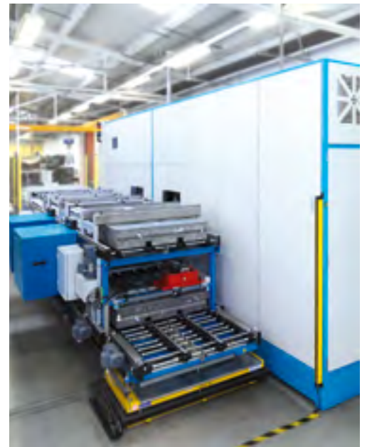
Figura 1: LIMPIO con dos cubas.