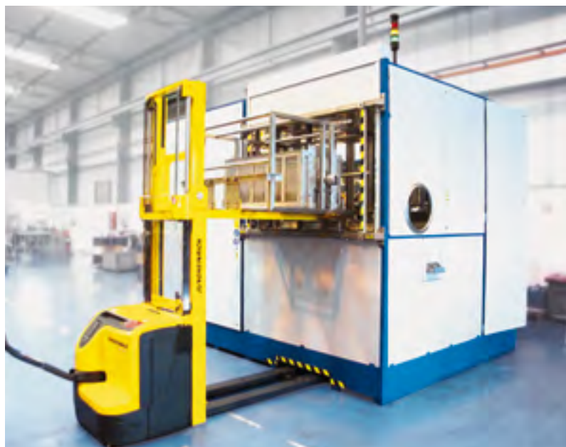
Figura 3: GIGANT FRONT-TOP-LOADER de carga manual.