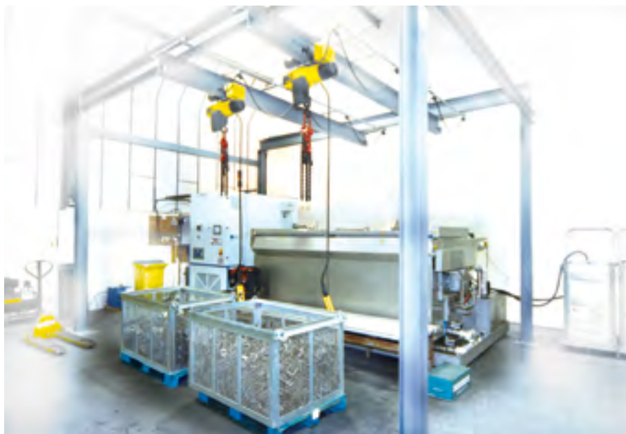
Figura 2: GIGANT TOP-LOADER con grúa doble.